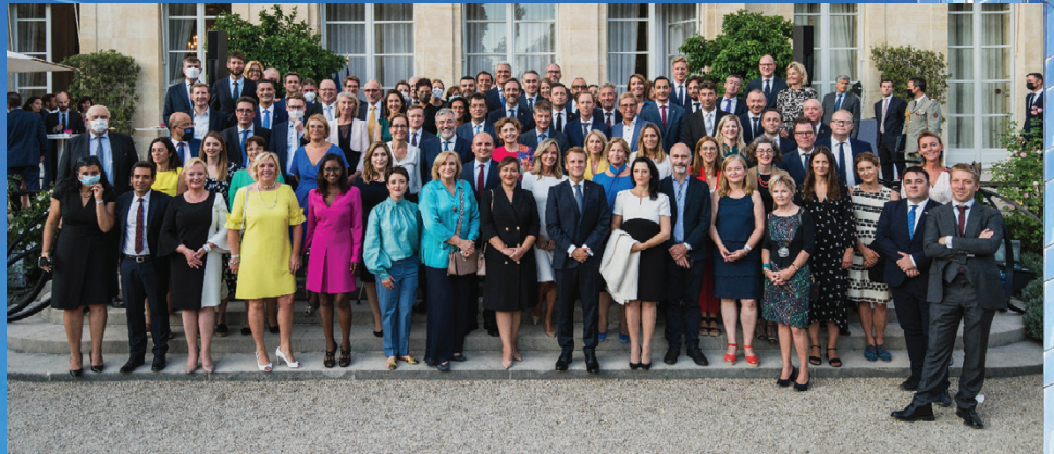
Renew Europe -ryhmä Ranskan presidentti Emmanuel Macronin vieraana Pariisissa 9/2021.